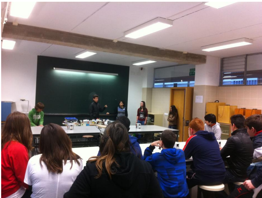
Alumnos del proyecto explicando a sus compañeros en que consistía el Test que iban a realizar

Laboratorio de Ciencias Naturales : en él los alumnos de cada grupo entraban y unos alumnos del grupo que realiza el proyecto daba una pequeña charla explicativa sobre los motivos por los cuales estaban allí y como se iba a desarrollar la prueba. Al respecto y a fin de hacer este Test lo más objetivo posible , no sabían nada más que se trataba de unas láminas en las cuales se podían distinguir números, formas o letras ; que tenían un tiempo limitado para decir el resultado y sobretodo que no importaba no ver nada (por aquello de que si te esfuerzas acabas viendo aquello que te dicen que has de ver) . Se rogaba a los alumnos que no dijeran el resultado en voz alta para no condicionar a los demás . Después de aclarar las posibles dudas , se les hacía pasar en grupos de 6 a la biblioteca donde realizarían la prueba.