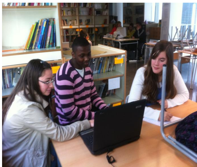
Alumnos de diferentes cursos pasando los Test supervisados por alumnos de 4º ESO . Otra alumna comprobando quien realiza el Test